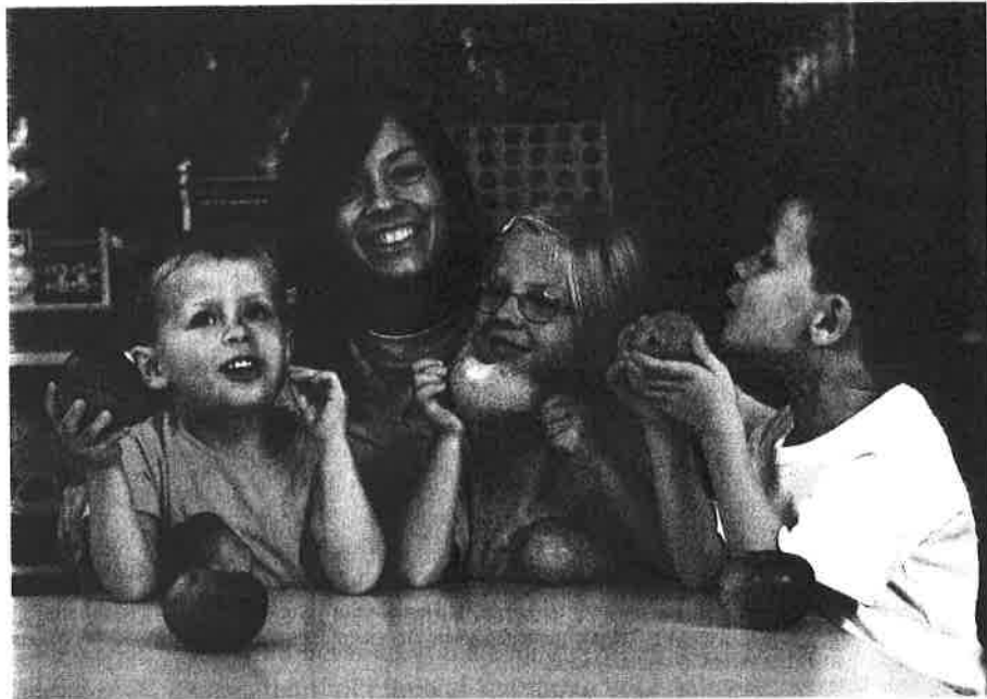
En pædagog på arbejde – et eksempel på social udlejring.

længere behøver at mødes og bytte frugt med kød for at lave en handel – man kan købe begge dele via online shopping. For at kunne indkøbe frugt og kød på denne måde, er man helt afhængig af abstrakte systemer i form af bl.a. et velfungerende internet, et velfungerende betalingskortsystem og et velfungerende postsystem. Andre eksempler på abstrakte systemer er fx: trafikkontrol af luftrummet, signaler i lyskryds og toget, kontrol af fx medicin og sikkerhedssystemer i biler.